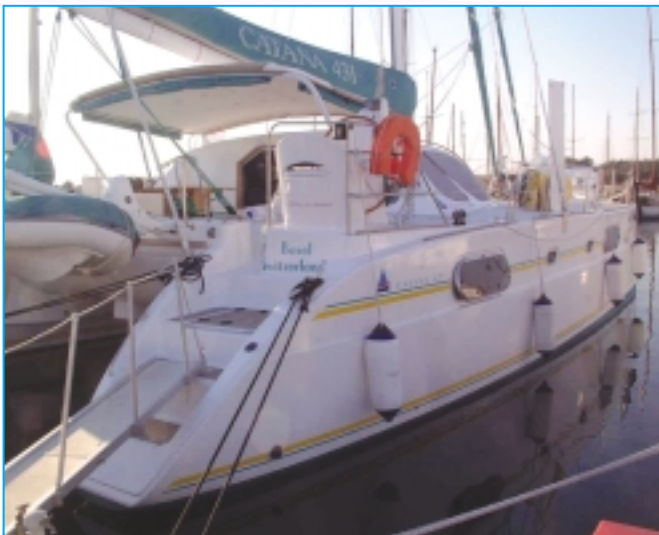
Die «Double Magic» bereit zur Fahrt aufs Meer.

Ich will meinen Horizont erweitern, das heisst neue Länder, Kulturen, Menschen und vor allem andere Denkweisen kennenlernen. Das hat natürlich seinen Preis, unter anderem der Verzicht auf ein geregeltes Leben und persönlichen Komfort, sicher mehr Risiko, aber auch Verzicht auf meinen grossen Freundes- und Bekanntenkreis und die Vorzüge einer funktionierenden staatlichen Infrastruktur. Ich bin aber überzeugt, dass ich mehr gewinne als verliere durch neue Freundschaften und Erkenntnisse, Abenteuer, faszinierende Begegnungen aller Art, Einsicht in andere Lebens- und Denkweisen, Chancen zur persönlichen Bewährung in schwierigen Situationen und generell mehr Lebensqualität. Das «Sein» wird wichtiger als das «Haben», also genau das zu tun, was man eigentlich möchte.