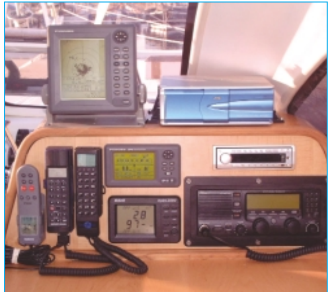
High-Tech: Die Navigationsgeräte sind für Segler von grösster Bedeutung.