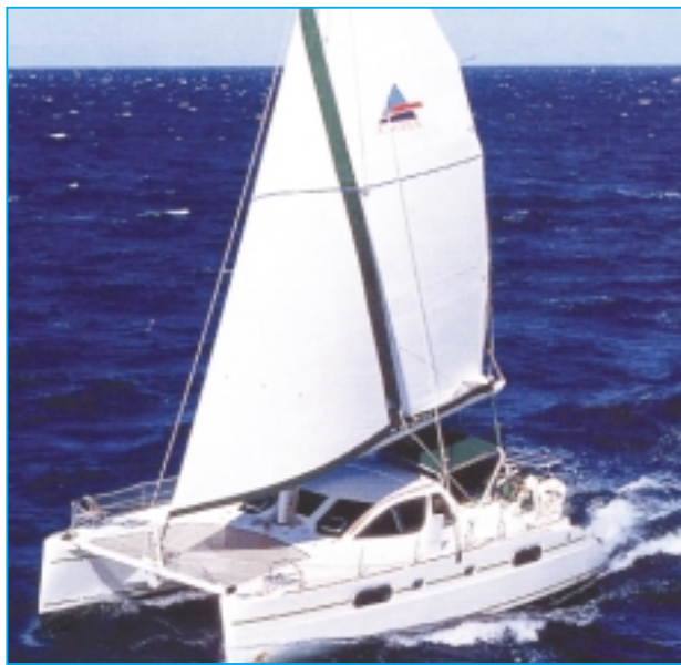
In vollem Speed unterwegs.

Technik ist allerdings anfällig und man muss jederzeit in der Lage sein, auch ohne sie den Zielhafen zu erreichen. Ich führe einen zweiten PC mit, zwei Reserve-GPS-Geräte sowie konventionelle Seekarten, um nicht von der Technik abhängig zu sein.