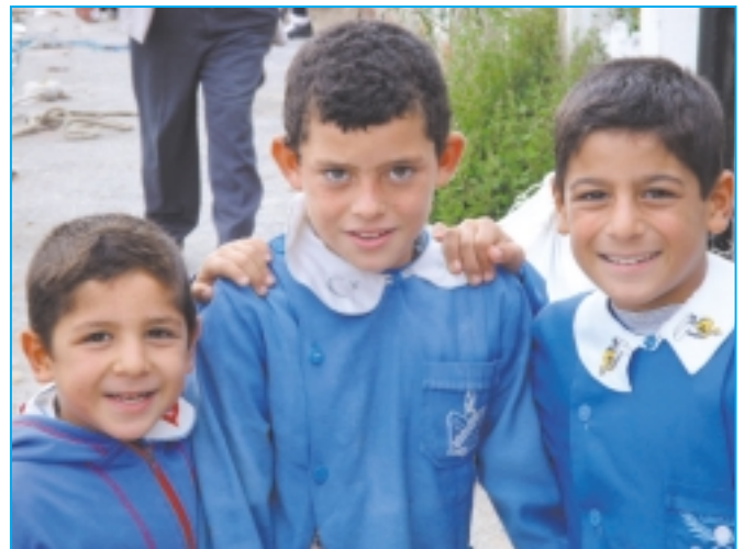
Kinder im Fischerdorf Poyraz.