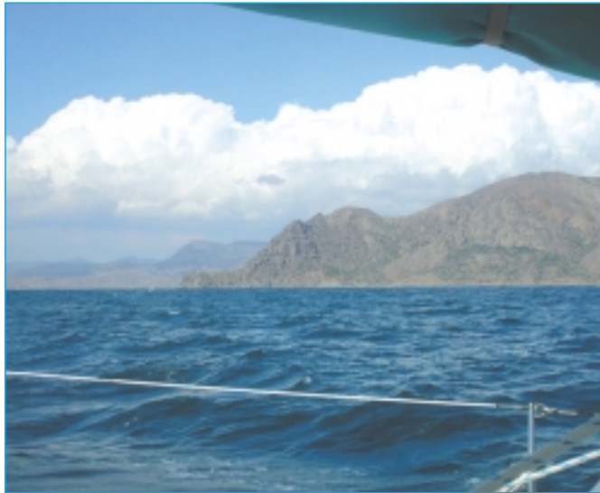
Segeln entlang der Krimküste.

ger gefunden. Traditionelle Handwerker gibt es kaum mehr, einzelne Felder werden nicht mehr bestellt, die Bauern verdingen sich lieber mit ihren Kamelen den Fremden, um übergewichtige Bleichgesichter auf Kamelrücken Sand und Steine aus der Nähe ansehen und sich gemeinsam mit ihrem Kamelführer fotografieren zu lassen. Eine abscheuliche Prostitution der eigenen Kultur.