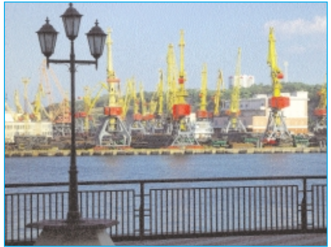
Der Handelshafen von Odessa (Bild oben).

Reichtum wird hier auf schamlose Weise vorexerziert. Später erfahren wir vom Marina-Manager, dass das Hotel Mozart der Mafia-Treffpunkt in Odessa ist. Wahrscheinlich gehört auch das Hotel selbst wie die meisten andern Restaurants und Hotels der Stadt der lokalen Mafia. Darum sind Touristen in Odessa wie