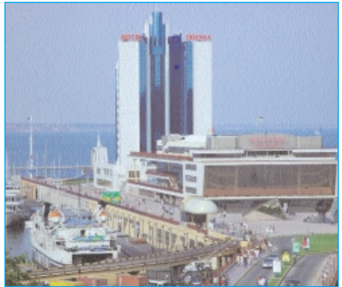
Blick von der Potemkintreppe zum Hotel Odessa und der Anlegestelle der grossen Schiffe (Bild links).

Weltumseglung Thomas Fischer, Küssnacht (7. Etappe): Odessa