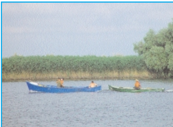
An der Arbeit: Fischer auf der Donau.