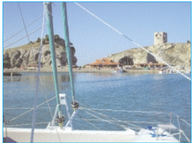
Nach Passieren des 18 Meilen langen Bosporus erreicht die «Double Magic» den malerischen Hafen Poyraz am rechten Bosporus-Ufer; nur wenige Meilen vom Eingang zum Schwarzen Meer entfernt.

Ich drehe nach einer Stunde in den Wind und nehme das gereifte Grosseegel herunter, da wir sonst die Einfahrt verpassen. Die Donaeinfahrt können wir nur im Radar sehen und wir motoren vor der Mündung hin und her. Nach weiteren 10 Minuten ist der Spuk vorbei. Wir sind nass wie ein Cocker Spaniel nach der Entenjagd, aber der Double Magic hat diese Süswasserdusche gut getan. So hat das Salzwasser weniger Chance, die Chromstahlbeschläge zu zersetzen.