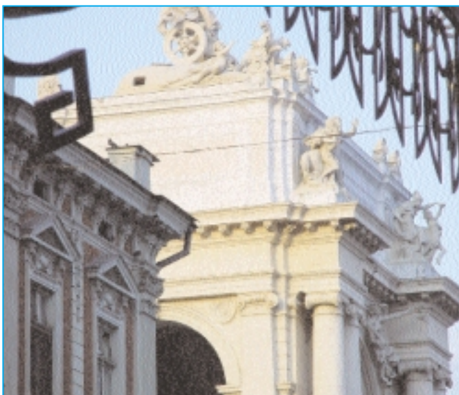
Bauten im Zentrum von Odessa.