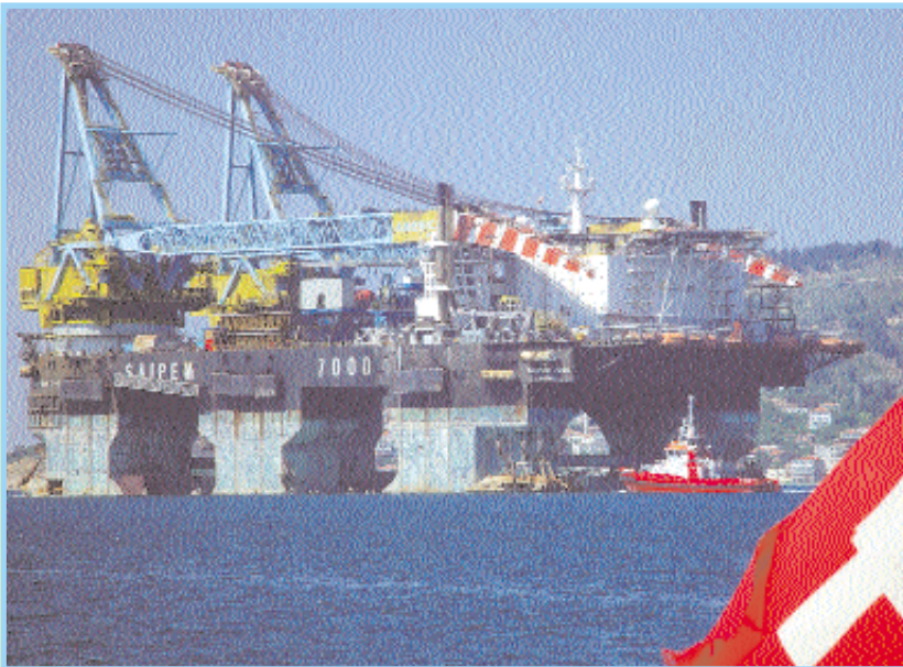
Ein imposantes Bild unterwegs: eine riesige Ölplattform auf Reisen.

Aus dem 4. Bericht von Bord der «Double Magic»