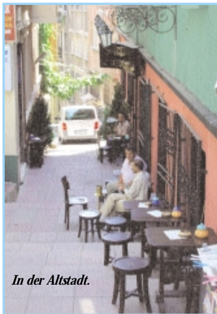
In der Altstadt.

Am Himmel ballen sich dunkle Wolken, nachdem es schon den ganze Nachmittag bedeckt war. Ich prüfe nochmals den Anker