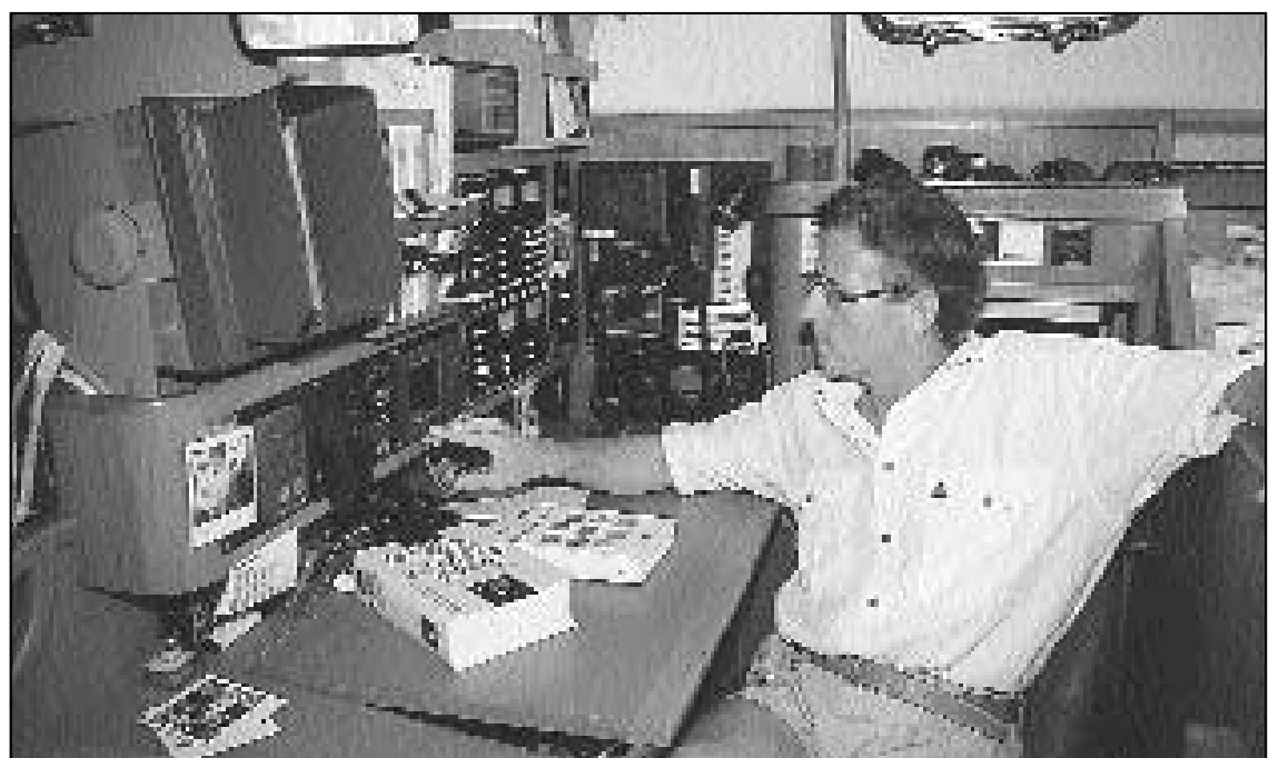
Satellitentelefon und modernste Navigationstechnik im Bootsinnern.