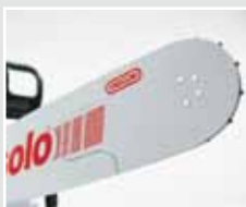
Vollstahlschiene für professionellen Einsatz