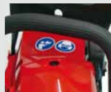
Dekompressionsventil für leichten Start