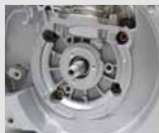
Extrem belastbare Magnesium-Kurbelgehäuse und Hauptgehäuse. Kompakte Bauweise.