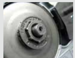
Powermate® Ritzel Zweiteilige professionelle Kupplungsglocke mit austauschbarem Kettenring