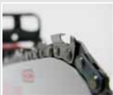
Vollmeißelkette für aggressiven Schnitt

Die leistungsstarke professionelle Universalsäge für alle Forstarbeiten bis zum Holzeinschlag in mittleren Beständen. Mit ihrem erstaunlich geringem Gewicht steht die zig-tausendfach bewährte Idealmaschine als Beispiel für Robustheit und Standfestigkeit.