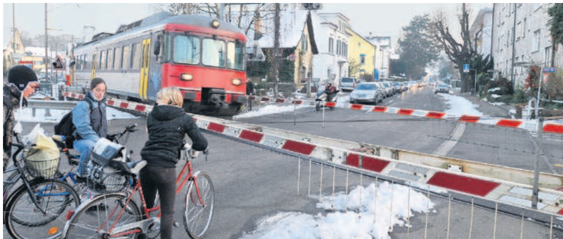
In der Stadt (wie hier in Veltheim) hat der öffentliche Verkehr Priorität. Ausserhalb sollen neue Strassen für eine bessere Situation sorgen.