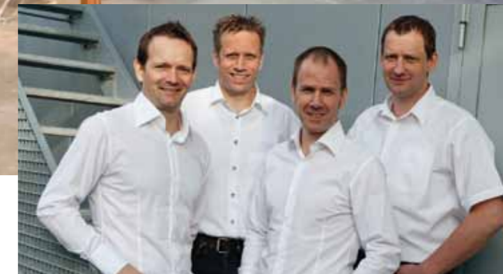
Das Kader der Keller Glas AG Winterthur