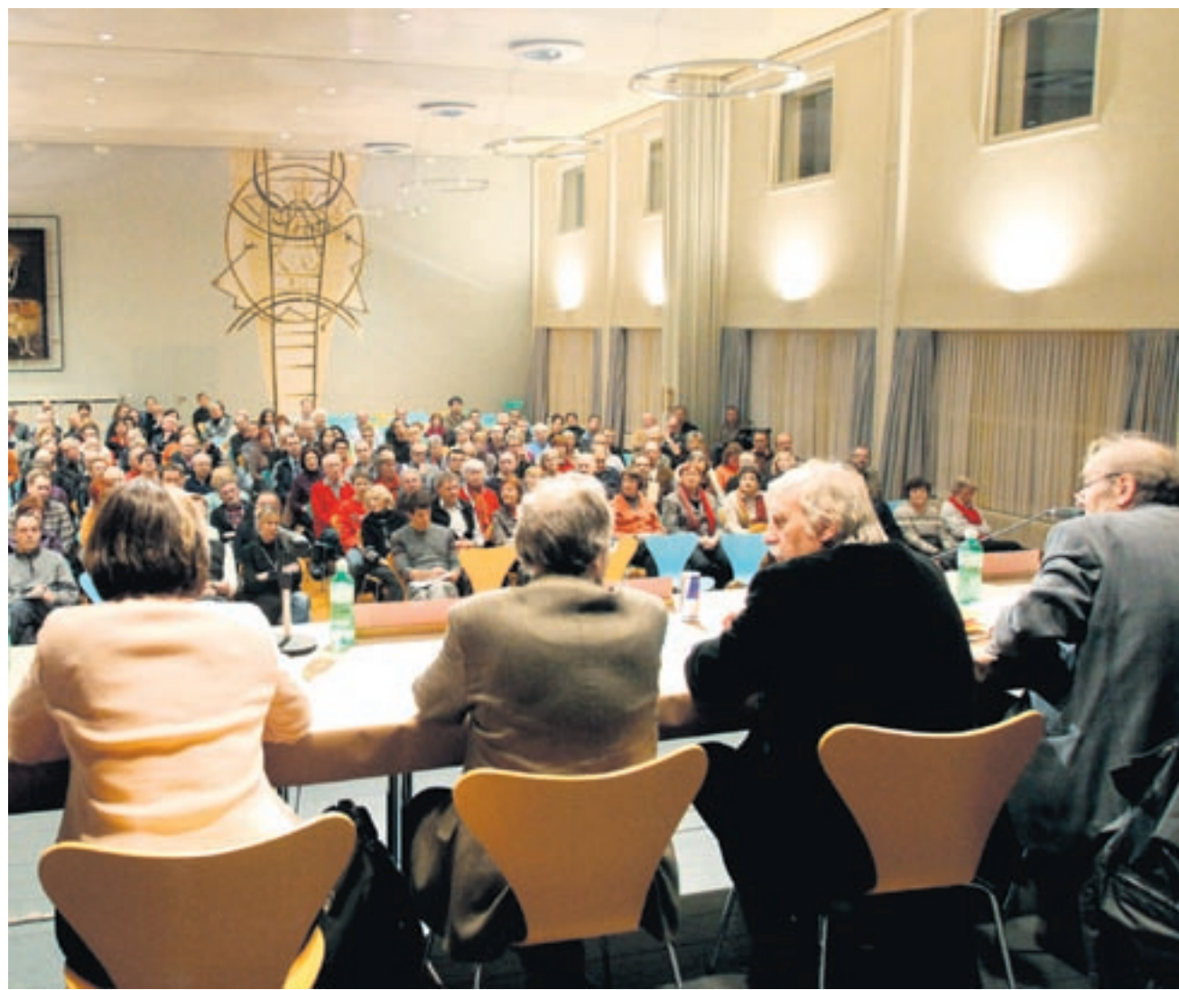
Die Landsgemeinde in Veltheim war gut besucht. Der Stadtrat nutzte die Gelegenheit und gab sich volksnah.