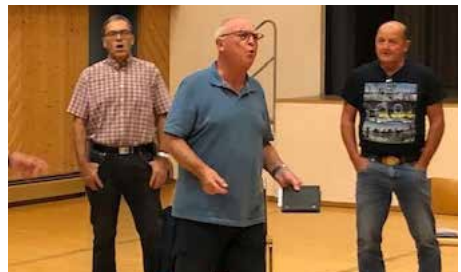
Schwungvoll die Probenarbeit wieder aufgenommen. Wegen Abstandsregeln in der Mehrzweckhalle Uttwil

Noch bis im Februar werden wir in der Mehrzweckhalle Uttwil unsere sängerischen Manöver einüben, perfektionieren und uns auf die nächsten Auftritte vorbereiten.