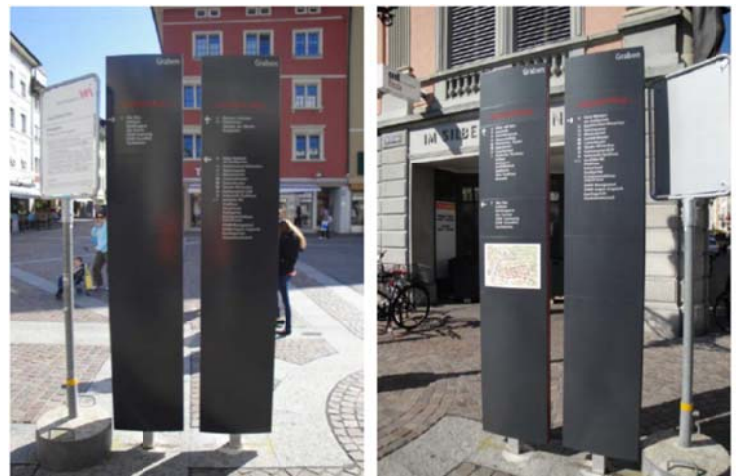
Beispiel einer ausgeführten Sammelstele