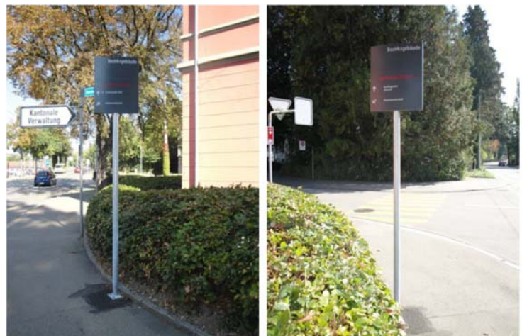
Beispiel eines ausgeführten einfachen Wegweisers