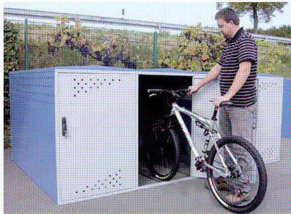
Modell BikeBox 1 als Reihenanlage.