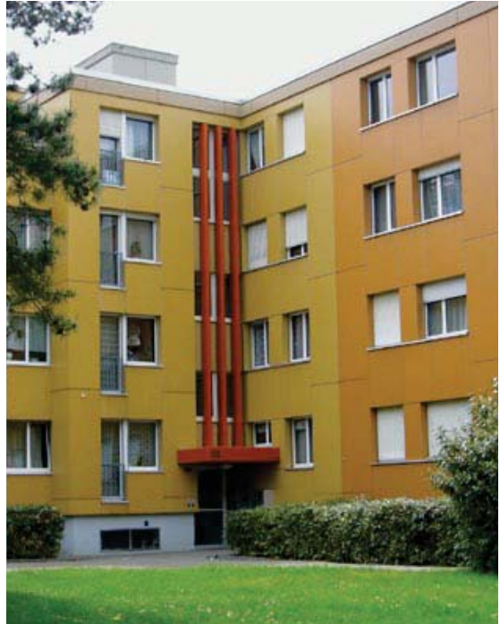
Die Fassade im neuen Anstrich

Das Ergebnis darf sich sehen lassen. Die Genossenschafter der Siedlung freuen sich heute über funktionale Bäder und einladende Treppenhäuser. Ein zusätzliches Zuckerchen ist die Tatsache, dass die Renovation keine Mietzinserhöhung für die Mieter zur Folge hatte. Dies, weil wir die Überbauung erst 2003 gekauft hatten und unseren Mietern nicht bereits nach fünf Jahren die erste Mietzinserhöhung zumuten wollten.