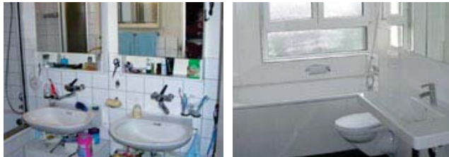
Die neuen Badezimmer wirken hell und modern