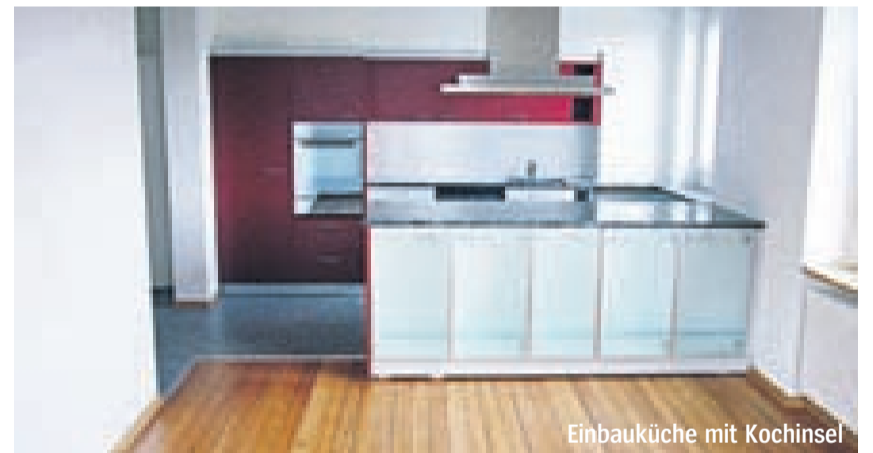
Einbauküche mit Kochinsel

Schreinerei Schneider Landstrasse 70 8450 Andelfingen 079 758 65 90 p.schneider@schneiderschreiner.ch www.schneiderschreiner.ch