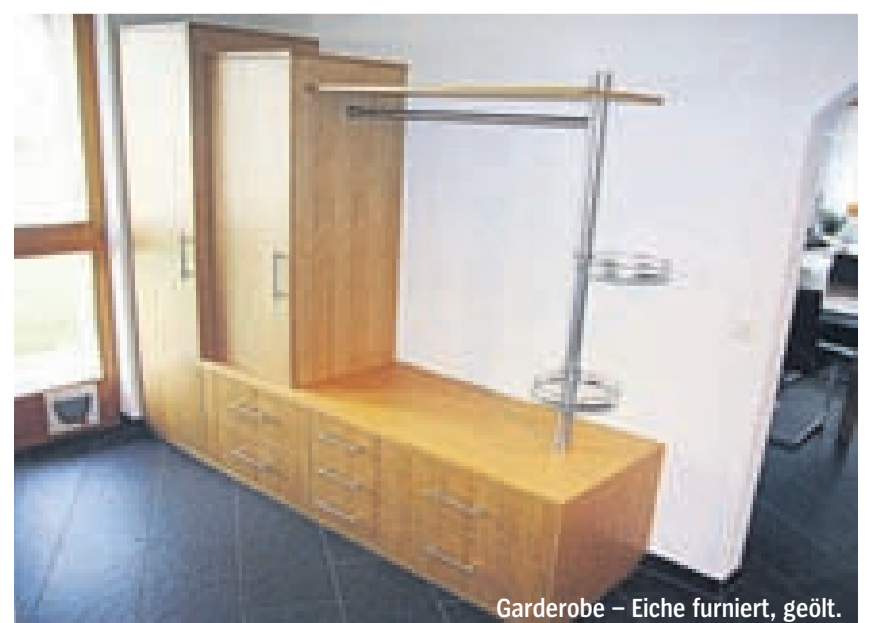
Garderobe – Eiche furniert, geölt.